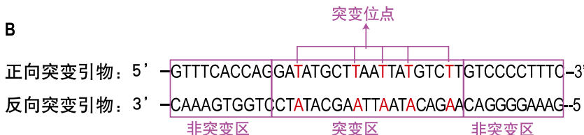
图2 TIANGEN 快速定点突变试剂盒引物设计原则